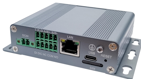
图 3-1、TE310 5G 数据终端

注意：安装挂耳为选配件，根据产品供货批次不同，外观可能稍有不同，具体以实物为准。